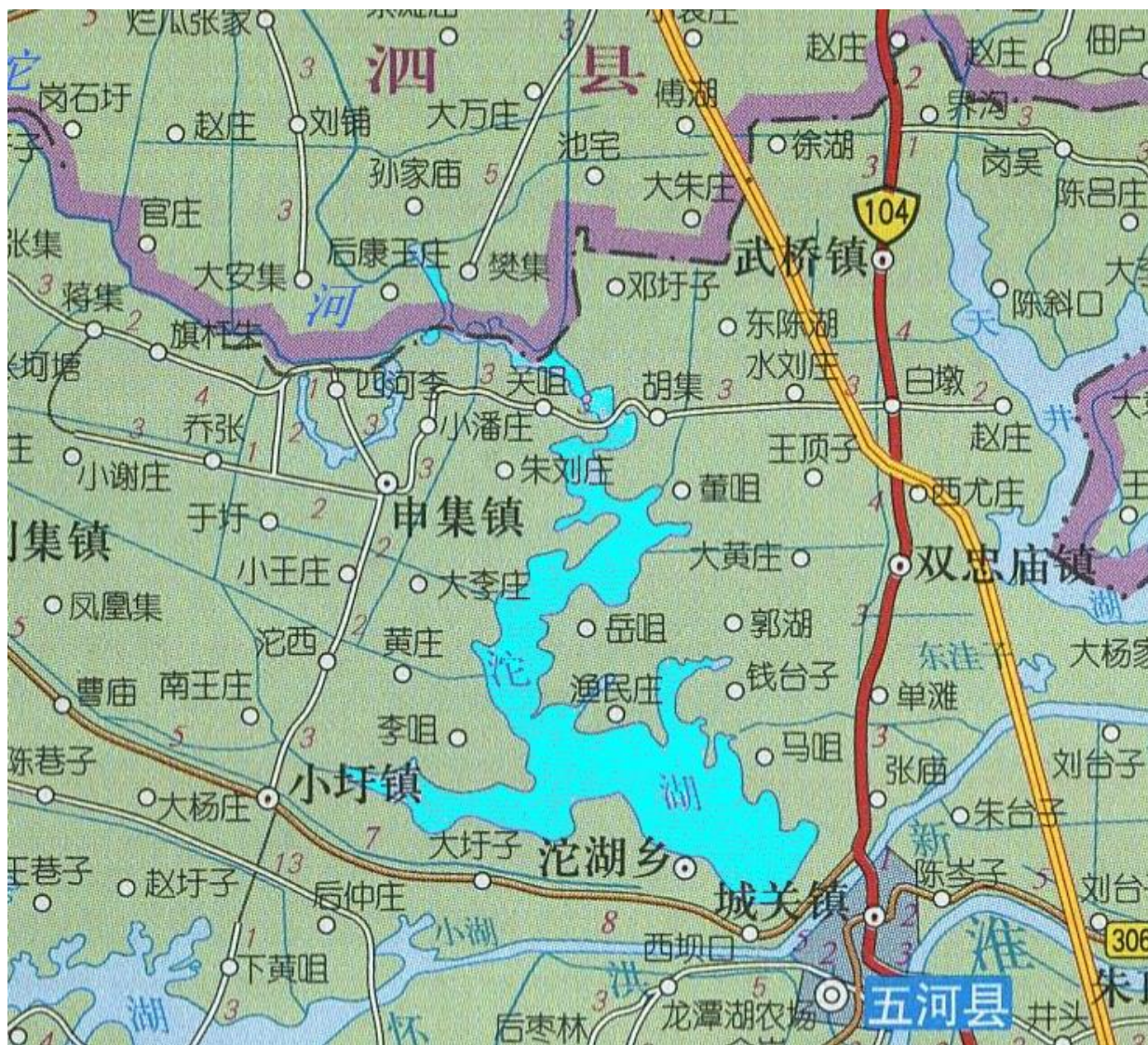
图 1-1 沱湖地理位置图

占全县土地总面积的 15.33%，其中湿地类型河流湿地、湖泊湿地、沼泽湿地与人工湿地四类，湿地型有永久性河流、洪泛平原、永久性淡水湖、草本沼泽、库塘、运河输水河、淡水养殖场等 7 种湿地型，湿地类型以河流湿地、湖泊湿地为主，湿地内生态系统复杂多样，是众多野生动植物的物种宝库，尤其是水鸟类、两栖类、爬行类、鱼类等多种水生动植物的生长栖息之地。